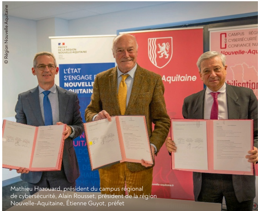
Mathieu Hazouard, président du campus régional de cybersécurité, Alain Rousset, président de la région Nouvelle-Aquitaine, Étienne Guyot, préfet

Le campus régional de cybersécurité et de confiance numérique pour la Nouvelle-Aquitaine a été créé en octobre 2022 dans un contexte d'augmentation du nombre de victimes de cyberattaques. Un peu plus d'un an plus tard, le préfet de région, le président du conseil régional et le président du campus ont signé, le 8 janvier, une convention de coopération visant à intensifier l'action commune de prévention, d'anticipation et d'optimisation de la prise en charge des victimes. Le centre de réponse aux attaques informatiques (CSIRT) est la première brique opérationnelle à avoir été développée au sein du campus. Il a pour mission principale de proposer un service de réponse aux incidents de premier niveau, dédié aux acteurs de taille intermédiaire.