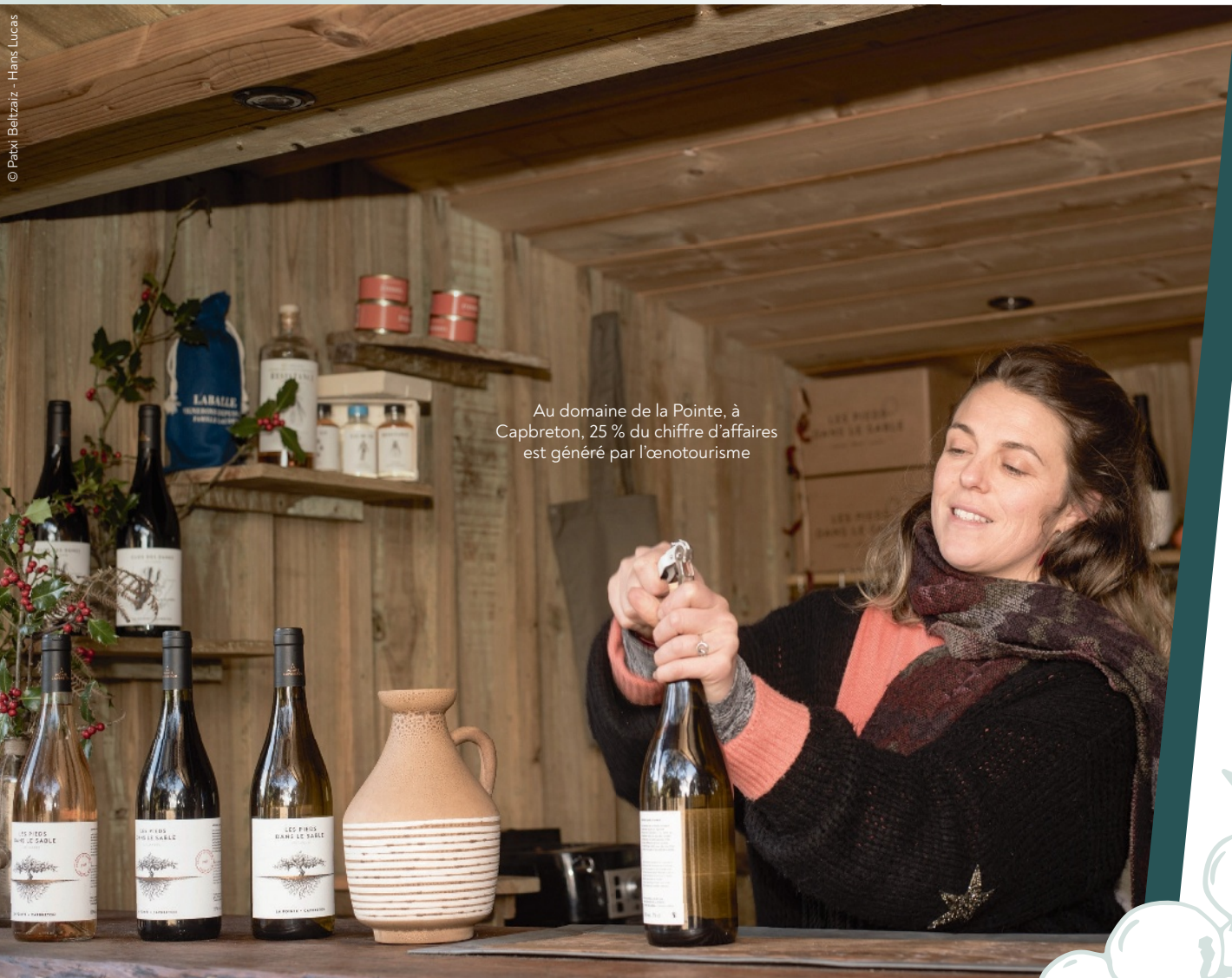
Au domaine de la Pointe, à Capbreton, 25 % du chiffre d'affaires est généré par l'œnotourisme

Dans l'évolution de son chiffre d'affaires, la part de l'armagnac s'impose toujours un peu plus. « Cela fait moins de 10 ans que je vends de l'armagnac : le stock de mon grand-père que j'avais racheté et les miens entrés en production il y a 15 ans. J'essaie de développer ce marché-là. » Il y a sept, huit ans, il lançait le slogan « Armagnac is back », quasiment un mantra symbolisant sa foi en cette boisson ancestrale à laquelle il avait apporté sa griffe, se démarquant de ses confrères. « La tendance c'était plutôt d'avoir de la structure, de la puissance. Moi mon ins-