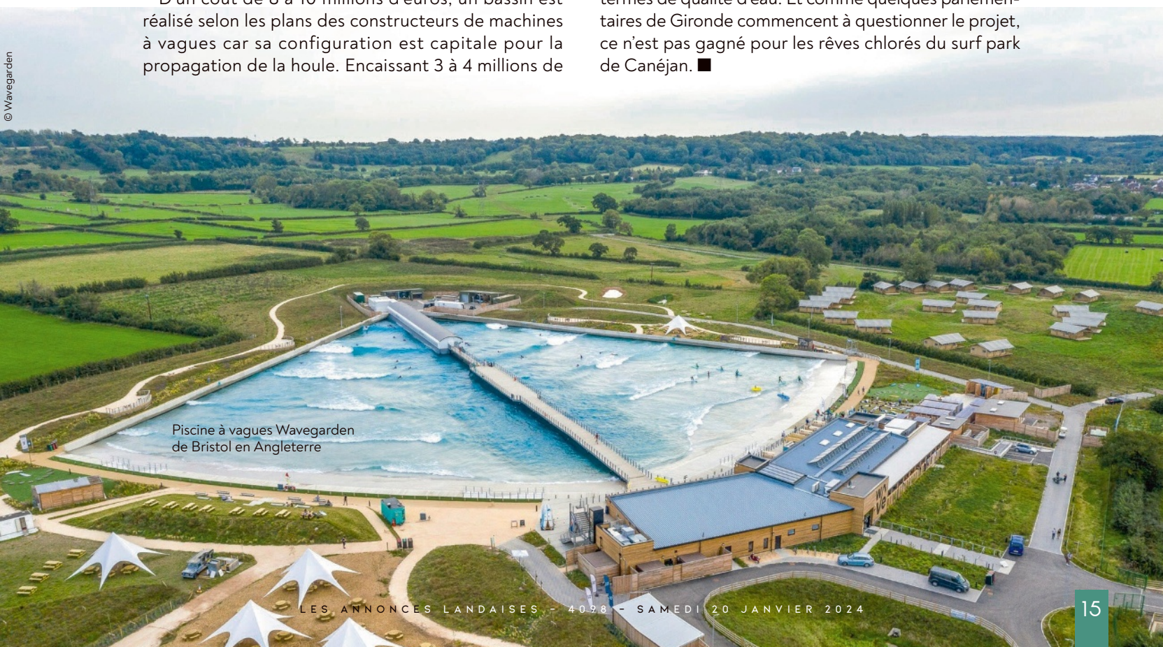
Piscine à vagues Wavegarden de Bristol en Angleterre

Mais c'est essentiellement la question environnementale qui a condamné les projets de piscine à vagues dans le Sud-Ouest. Aberration écologique pour les défenseurs de l'environnement, le surf park de Canéjan d'un volume de 20 000 m 3 d'eau (soit huit piscines olympiques) consommera de 147 000 à 280 000 m 3 d'eau par an selon ses détracteurs car l'eau s'évapore avec l'écume des vagues. Autre question relative à l'eau avec le classement « activité nautique » accordé par l'Agence régionale de santé au projet alors qu'un classement « baignade artificielle » demandé par la Fédération française de surf serait beaucoup plus contraignant en termes de qualité d'eau. Et comme quelques parlementaires de Gironde commencent à questionner le projet, ce n'est pas gagné pour les rêves chlorés du surf park de Canéjan. ■