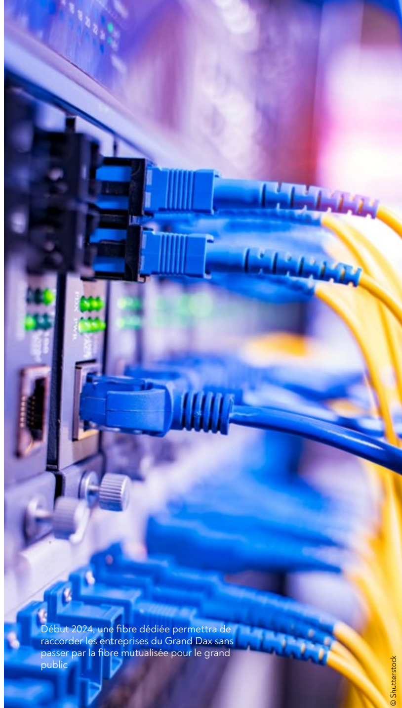
Début 2024, une fibre dédiée permettra de raccorder les entreprises du Grand Dax sans passer par la fibre mutualisée pour le grand public

« Les chantiers avancent à grands pas, a souligné Arnaud Delaroche. L'année qui s'achève a vu l'installation de quelque 3 500 nouvelles prises de Saint-Vincent-de-Paul à Heugas, en passant par Saint-Paul-lès-Dax, 500 km de fibres supplémentaires ont été déployés par voies aériennes ou souterraines. À la fin de