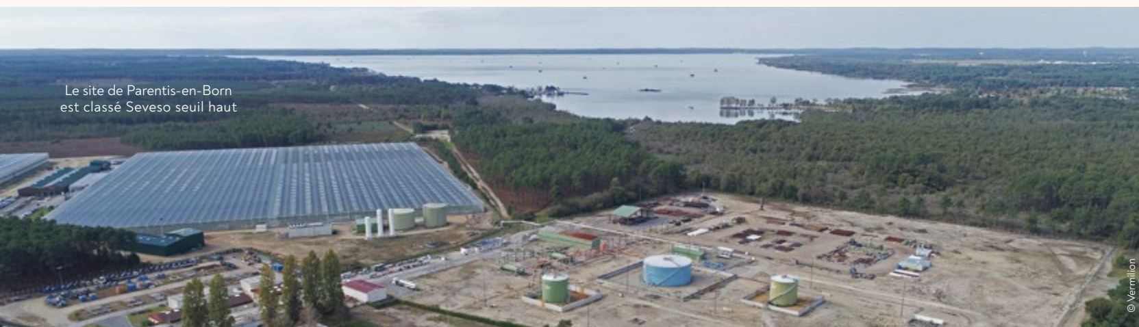
Le site de Parentis-en-Born est classé Seveso seuil haut

Si Emmanuel Macron vient d’assurer lors de la COP28 sur le climat à Dubaï que la France devrait « définitivement tourner la page du pétrole d’ici à 2040-45 », l’échéance apparaît, aux yeux de certains, comme un objectif impossible, un peu comme pour le glyphosate dont l’autorisation vient d’être prolongée pour 10 années supplémentaires dans l’Union européenne. En 2022, Fabien Lainé, alors député de la circonscription, a d’ailleurs plaidé pour repousser l’interdiction d’exploitation de pétrole en France à 2050, disant l’intérêt de conserver cette ressource notamment pour l’armée française. « Nous avons toujours besoin de pétrole, et ce sera le cas après 2040. Nous