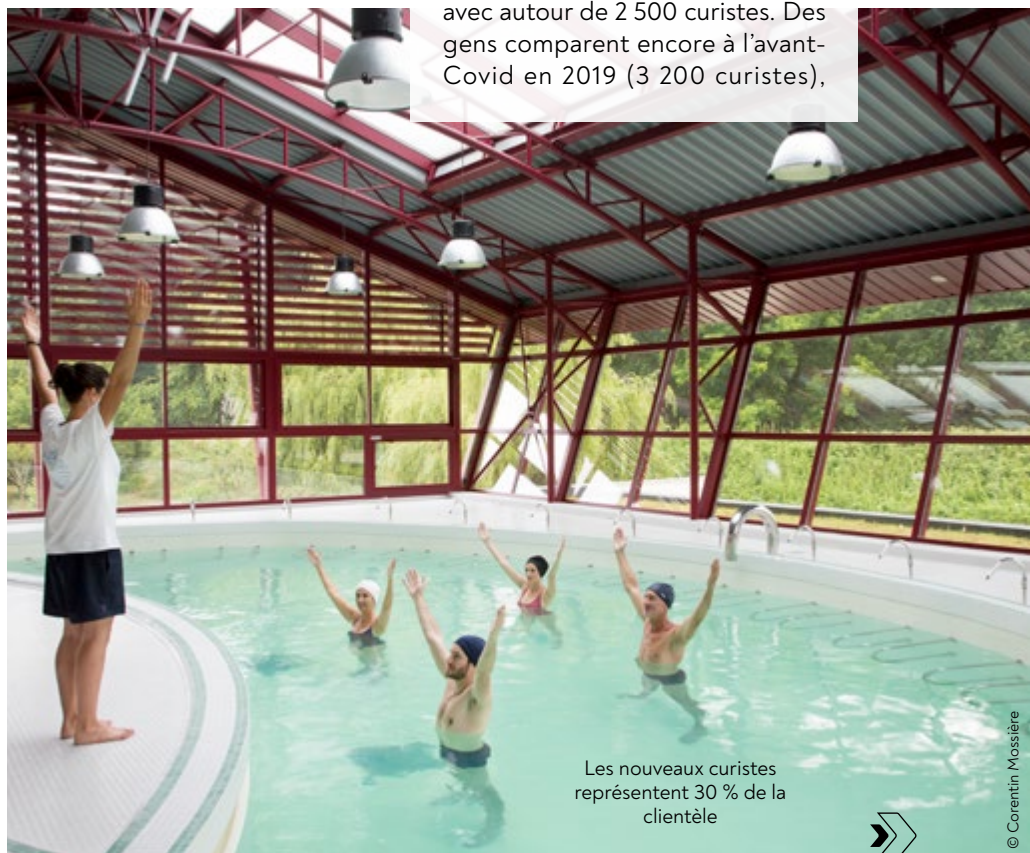
Les nouveaux curistes représentent 30 % de la clientèle

chez Procter & Gamble, puis je suis partie en VIE (Volontariat international en entreprise) au Vietnam, avant de revenir en France chez Sodebo. Je suis repartie travailler pour des produits professionnels en pâtisserie, pour toute la zone Asie Pacifique, entre Hong Kong et Hô Chi Minh-Ville. Des circonstances personnelles, puis la période Covid, ont fait que j'en ai eu assez des voyages professionnels au bout de 15 ans. J'avais envie d'autre chose et le thermalisme m'a attirée, moi qui crois beaucoup dans les médecines naturelles. J'ai postulé à la Chaîne thermale du soleil sans trop y croire vu mon parcours dans l'agroalimentaire... Et ça s'est fait ! Mon premier poste a été dans la station de Saint-Laurent-les-Bains en Ardèche, c'était un gros choc à l'arrivée. Mais j'adore ce que je fais, c'est un métier très humain, dans des petites structures, au contact des salariés et des curistes à qui on fait du bien au quotidien.