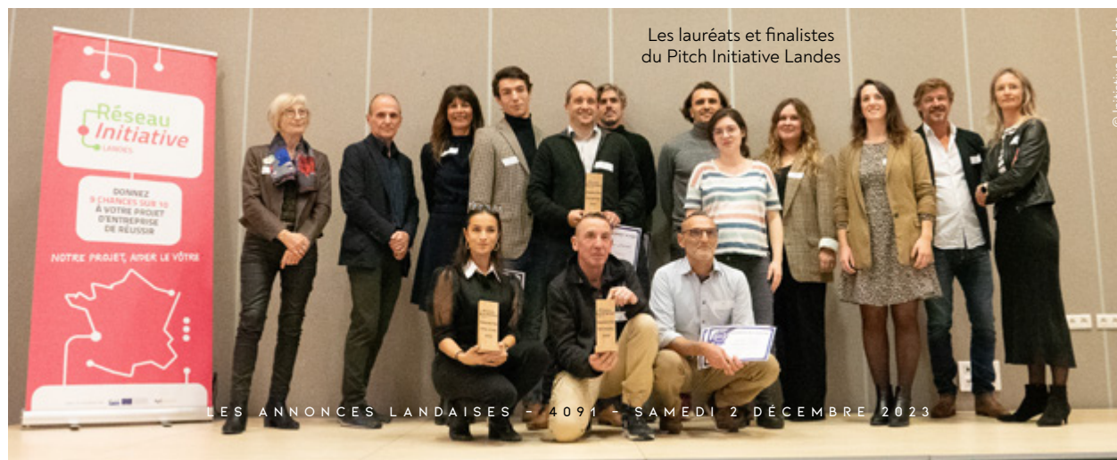
Les lauréats et finalistes du Pitch Initiative Landes