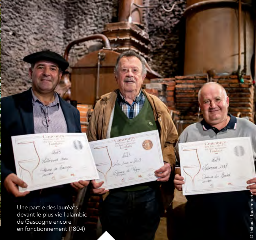
Une partie des lauréats devant le plus vieil alambic de Gascogne encore en fonctionnement (1804)