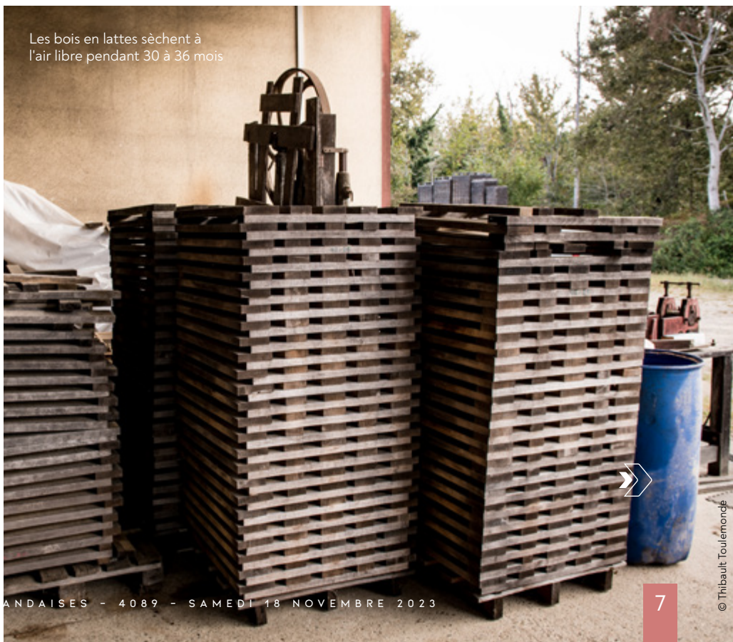
Les bois en lattes séchent à l'air libre pendant 30 à 36 mois

rie en plus. On a tous les mêmes fournisseurs français de chêne. Il y a quelques années, je pouvais discuter les prix. Maintenant on me dit : « Estimez-vous heureux d'en avoir ! ». En six mois, les tarifs du chêne à merrain sont passés de 4 000-4 200 euros le m 3 à 5 200-5 500 euros, soit des augmentations de 20 à 40 %. « On est obligé de répercuter une partie sur le client, sinon c'est le dépôt de bilan. » Aussi, le fût Bartholomo se facture désormais à 1 100 euros l'unité, contre 900 euros l'an dernier. « On perdra certainement des clients, certains comprennent, d'autres moins... »