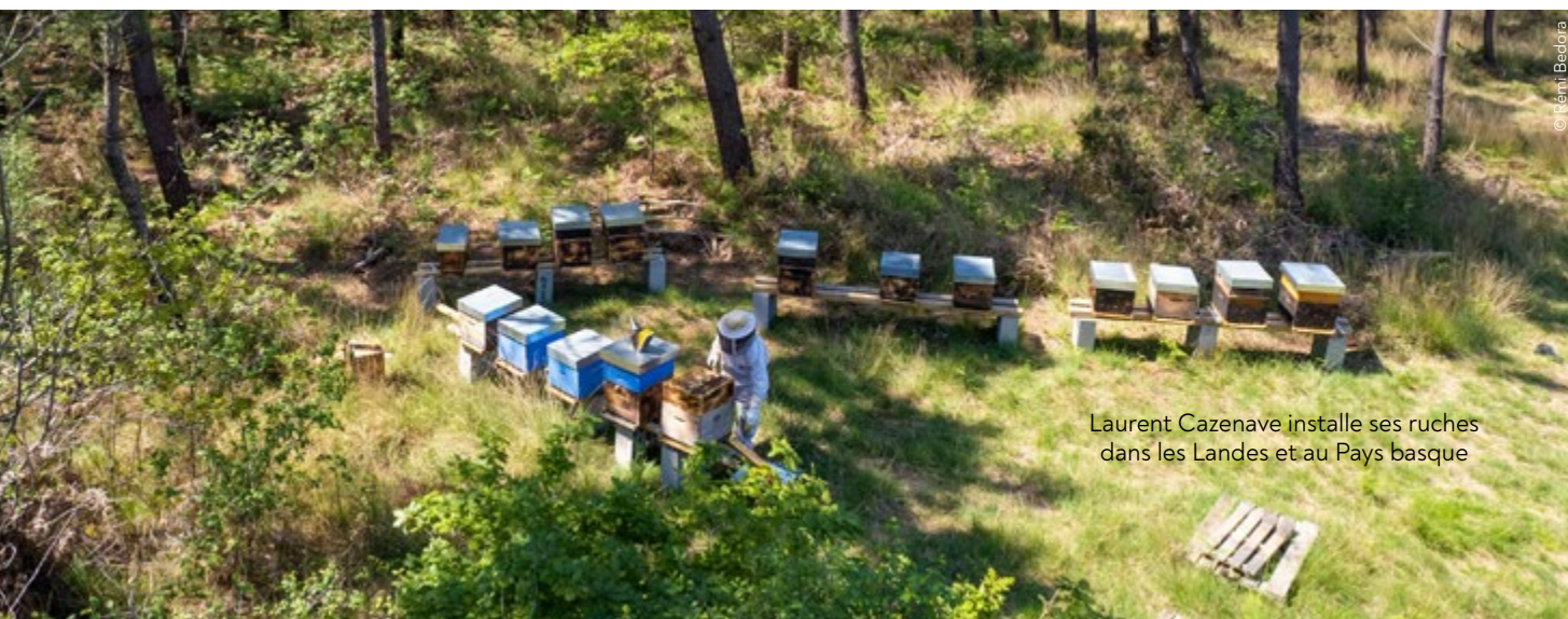
Laurent Cazenave installe ses ruches dans les Landes et au Pays basque