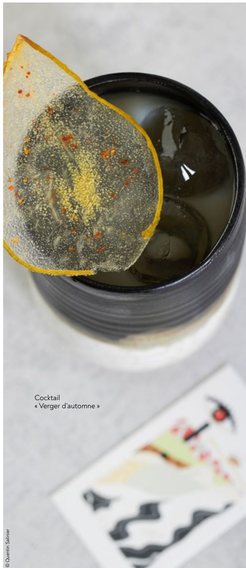
Cocktail « Verger d'automne »

« Les spiritueux sont une richesse, celle de l'expérience, du savoir-faire et du patrimoine »