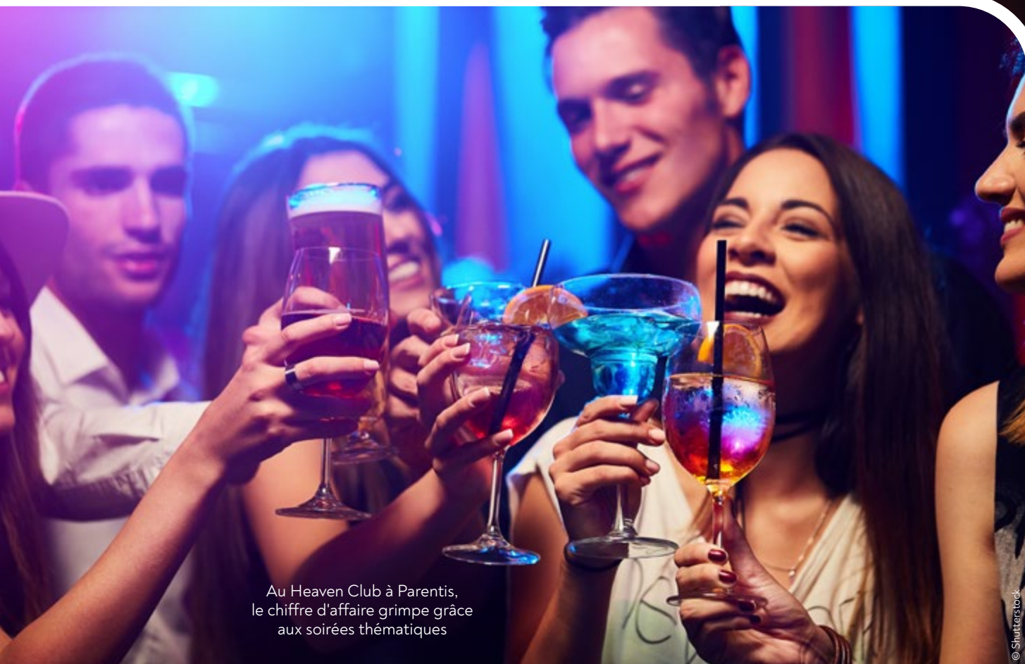
Au Heaven Club à Parentis, le chiffre d'affaire grimpe grâce aux soirées thématiques

soirées thématiques dont celles sur les années 1980 qui attirent les quadragénaires et quinquagénaires, et ses « soirées pouvoir d'achat », avec bouteille à quasiment moitié prix avant une heure du matin. « Les clients jouent le jeu et viennent plus tôt », assure le gérant qui poursuit, en parallèle, son activité avec sa société d'électricité en journée. À cinq l'hiver, avec « des grosses soirées jusqu'à 200 personnes », ils sont sept ou huit salariés les week-ends d'été, avec des renforts disponibles pour la sécurité. « Le monde de