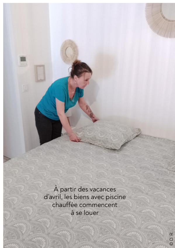
À partir des vacances d'avril, les biens avec piscine chauffée commencent à se louer

La Conciergerie M gère 14 maisons à Vielle-Saint-Girons, Léon et Moliets-et-Maâ. « Le potentiel est démentiel et vu la demande, on pourrait faire beaucoup plus. Mais nous ne trouvons pas de personnel sérieux et motivé. Alors, on travaille seulement tous les deux. » Le couple sélectionne avec soin les biens dont il accepte de s'occuper. « Aujourd'hui, il y a tellement d'offres en location saisonnière