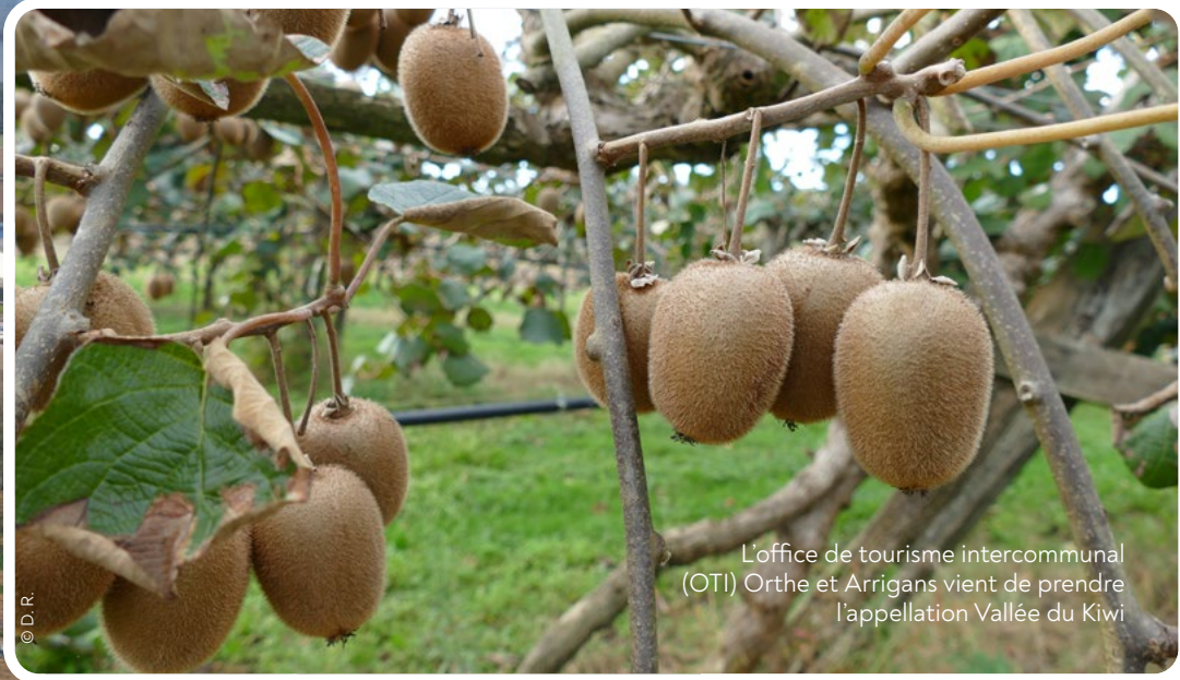
L'office de tourisme intercommunal (OTI) Orthe et Arrigans vient de prendre l'appellation Vallée du Kiwi

Sur la zone d'activités Sud Landes, la dizaine d'entreprises installées en deux ans représentent 1 000 emplois, et une deuxième tranche devrait ouvrir vers 2025 sur 17 hectares