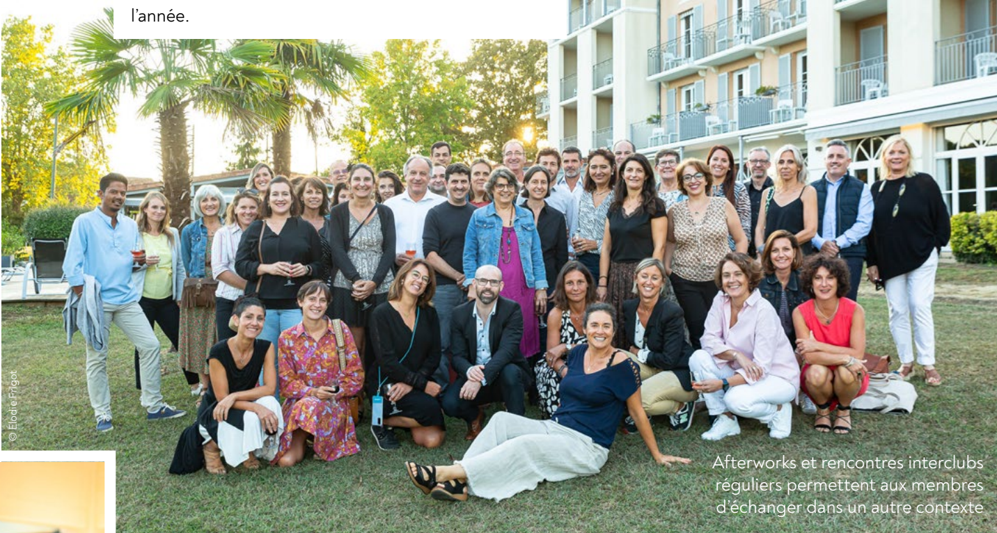
Afterworks et rencontres interclubs réguliers permettent aux membres d'échanger dans un autre contexte