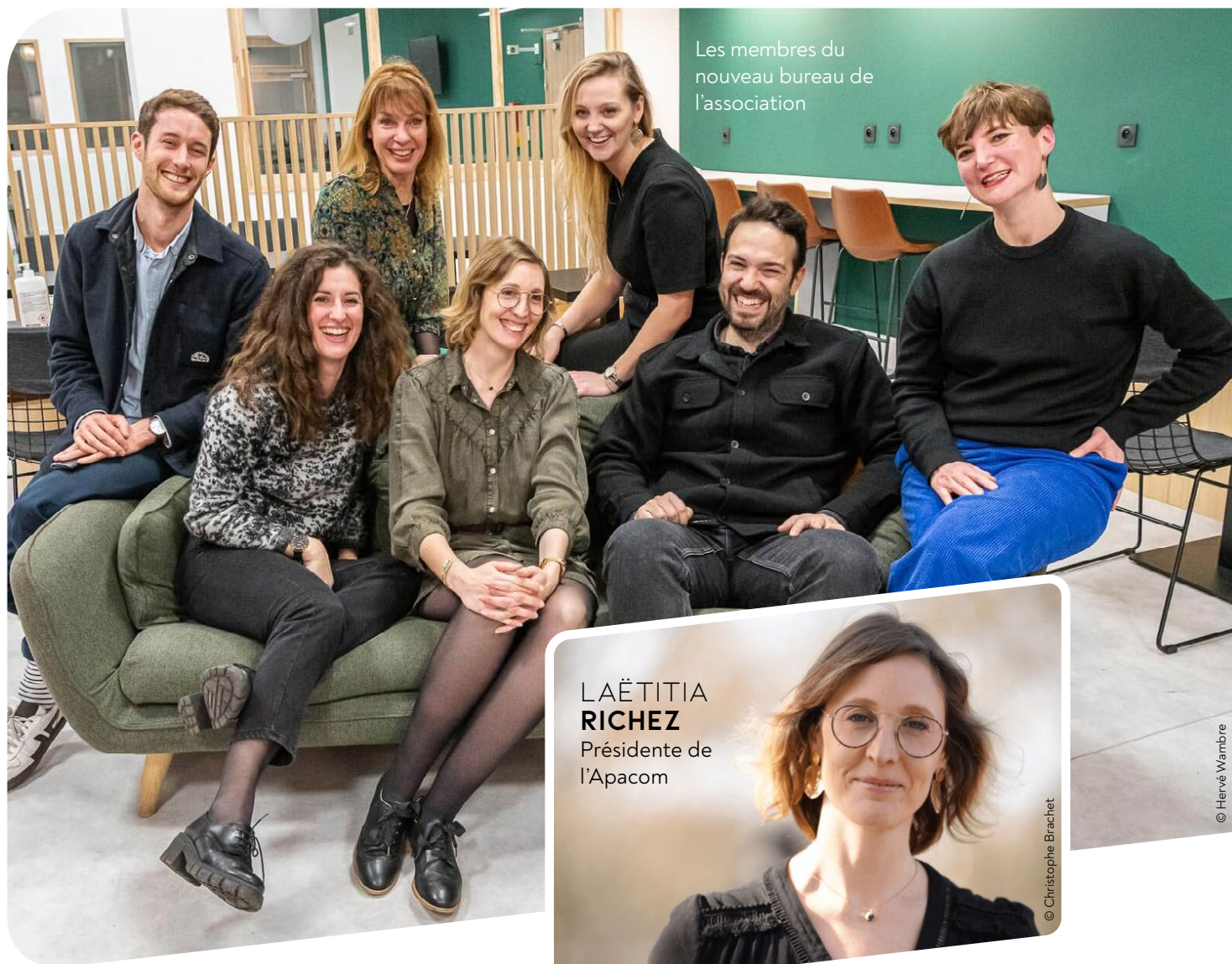
Les membres du nouveau bureau de l'association