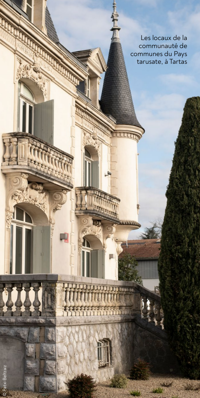
Les locaux de la communauté de communes du Pays tarusate, à Tartas