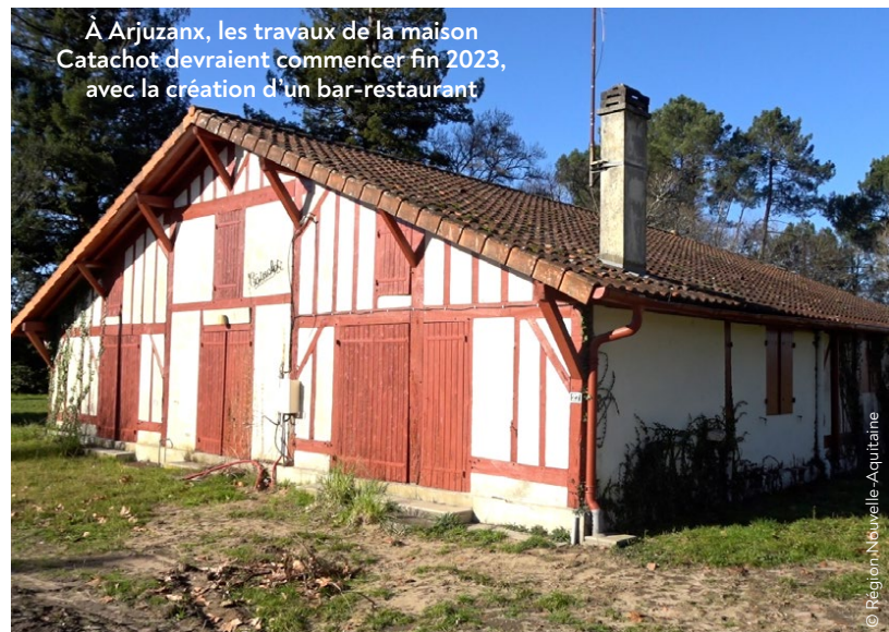
À Arjuzanx, les travaux de la maison Catachot devraient commencer fin 2023, avec la création d'un bar-restaurant

Tout un volet comprend également des créations ou réhabilitations de bâtiments commerciaux comme une épicerie à Lesperon, des logements et une boulangerie à Garein, la Halle à charbon à Brocas, l'amélioration de l'accueil à la salle de spectacle des Cigales à Luxey, etc.