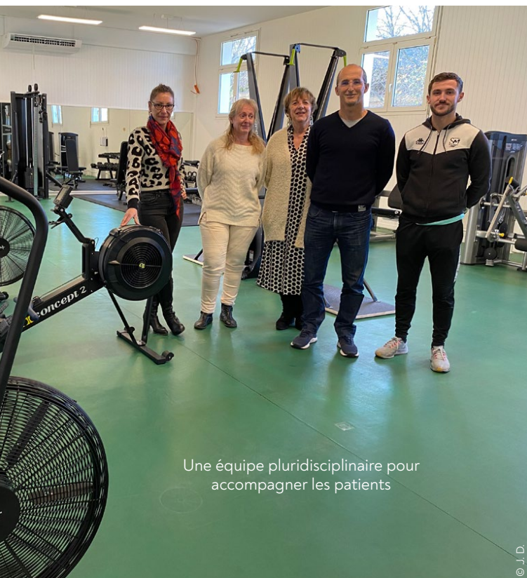
Une équipe pluridisciplinaire pour accompagner les patients

Le Domaine des dunes, à Mimizan, arrive en deuxième position des destinations estivales de l'enseigne Nemea en 2022. Le groupe bordelais de résidences vacances, créé en 1994, a accueilli pas moins de 340 000 vacanciers sur ses 88 résidences, soit une hausse de 13 % de son taux de remplissage par rapport à 2021, sur l'ensemble de ses destinations, avec une durée moyenne des séjours de sept jours. Une progression liée à un net retour, l'été dernier, des touristes étrangers (Belges, Hollandais, Allemands et Tchèques) qui représentent 20 % de sa clientèle. Capitalisant sur cette dynamique positive, le groupe annonce l'ouverture de nouveaux sites à Monétier-les-Bains dans les Hautes-Alpes, à Lacanau (Gironde) ou à Varaville sur la côte normande.